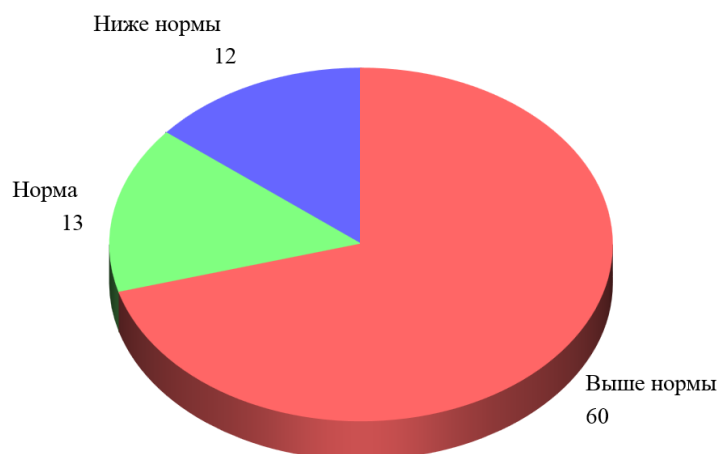
Навыки чтения в 3-х классах

У 85 детей сформирован навык чтения целыми словами. 56 учеников из 85 человек читают без ошибок, соблюдая интонацию, правильно произнося слова, но следует отметить, что 29 человек допускают замену, пропуск букв, ошибаются в ударении, допускают ошибки в окончаниях, при чтении допускают повторы некоторых слогов и слов.