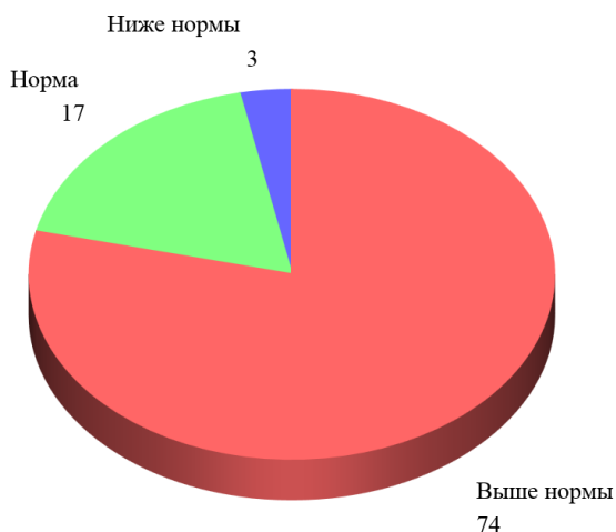
Навыки чтения в 1-х классах